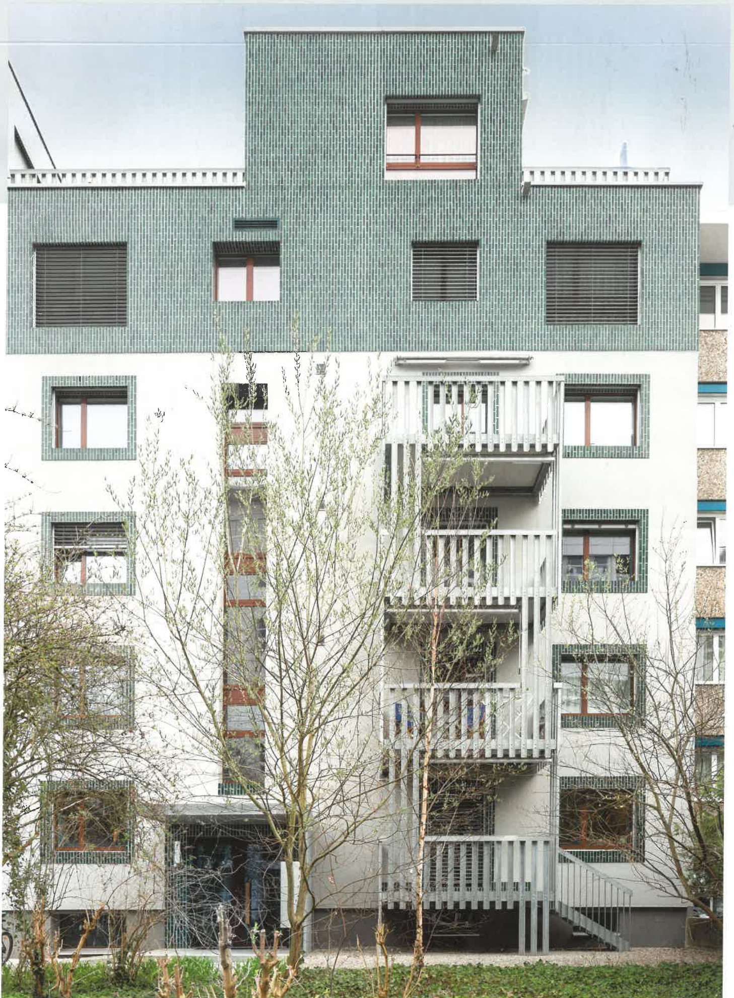
Die UNP-100-Lisenen mit ihren nach aussen gerichteten Schenkeln prägen das Erscheinungsbild der Balkonbauten. Les lésènes en UNP 100 aux ailes orientées vers l'extérieur caractérisent l'aspect visuel des balcons annexes.